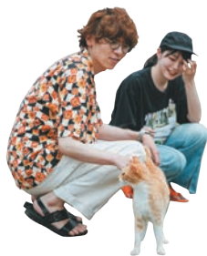
ネコスポット発見!

日が沈む直前にやって来たのは、リアス式特有の水面が穏やかな油壺湾。到着してもまもなく、空と海がピンク色に染まり、まるで絵画の中にいるような幻想的な