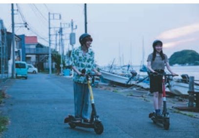
夕日に間に合うかな? ガンとスピードアップ!